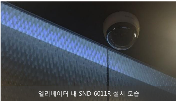
엘리베이터 내 SND-6011R 설치 모습