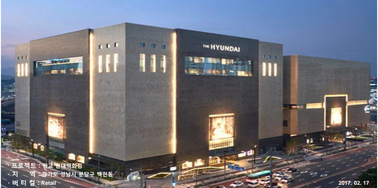
· 프로젝트 : 판교 현대백화점 · 지역 : 경기도 성남시 분당구 백현동 · 버티컬 : Retail