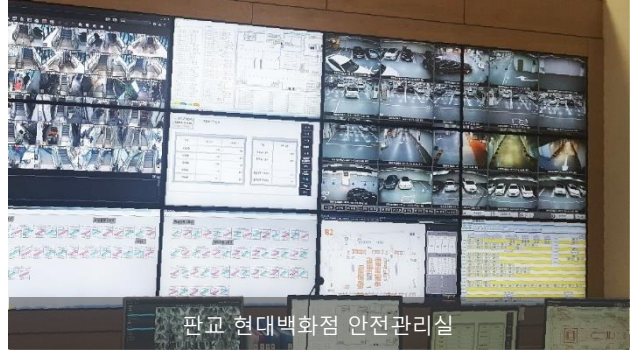
판교 현대백화점 안전관리실