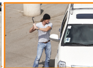
광학 20배 줌