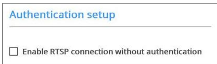
Figure 6. RTSP 인증 설정 화면

기본적으로 한화테크윈의 카메라는 사용자 인증 시 HTTP 프로토콜과 마찬가지로 RTSP 프로토콜에서도 다이제스트 인증 방법을 사용하기 때문에 비밀번호가 평문으로 노출되지 않습니다.