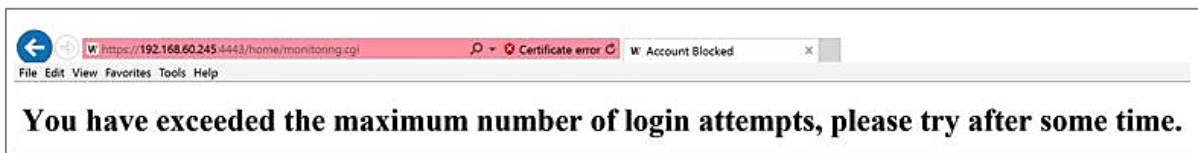
Figure 7. 비밀번호 입력 연속 5회 오류 시, 로그인 차단 화면

해커들은 기기의 비밀번호를 찾기 위해 매우 빠른 속도로 무작위 값들을 기기에 입력합니다. 이러한 행위를 허용할 경우, 일정 시간이 지나면 기기의 비밀번호가 노출될 수 밖에 없는 위험이 있습니다. 보안을 향상시키기 위해 한화테크윈의 기기는 30초 이내에 5번 이상의 비밀번호 무작위 입력 공격(Brute force attack)을 차단하고 있으며, 단순히 모든 연결을 차단하는 방법이 아닌 기존의 인증된 연결은 유지하고 비인가된 연결 시도만 차단함으로써 무작위 입력 공격을 통해 유발될 수 있는 서비스 거부(DoS) 공격까지 예방하고 있습니다.